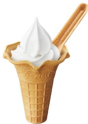
【北海道ミルクソフト】