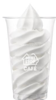
【得盛ソフトミルク】