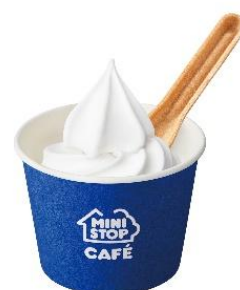
【カップ 北海道ミルクソフト】